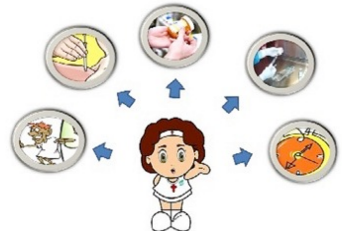
LOS 5 CORRECTOS EN LA ADMINISTRACION DE MEDICAMENTOS